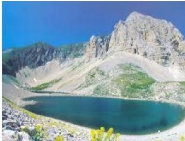
il lago di Pilato

Luoghi fatati, frequentati da maghi o negromanti (ai quali in un certo tempo si giunse perfino a vietarne l'accesso), montagne battute dal vento con oltre cinquanta vette che superano i 2000 m, pareti di roccia, morene, doline e vastissimi pendii, rivestiti in primavera dalla lussureggiante flora appenninica, capace di attirare centinaia di specie di farfalle. La più curiosa vola sulla montagna più alta, il Vettore, a quasi 2500 m d'altezza: forse proprio in onore di questi luoghi, è chiamata Erebia pluto belzebub. È sui Monti Sibillini che l'Appennino mostra la sua matura veste di massiccio calcareo, che prelude alle massime altezze abruzzesi. Qui le montagne hanno una maggiore rudezza di forma rispetto ai rilievi marnoso-arenacei della porzione toско-emiliana. Il paesaggio perde in dolcezza e acquista tratti severi, in una varietà dove è facile perdersi nello stupore della vista e ancor più nell'immaginario. Qui sarà la fantasia accesa dall'emozione a condurci per mano e a farci sentire davvero nel primo Parco Nazionale naturale che è anche luogo protetto del mito e della leggenda. La molteplicità degli ambienti naturali che si apre al visitatore rende instancabile il cammino alla scoperta del Parco, dai numerosi orizzonti, a cominciare dai fondovalle della Nera, del Fiastrone, del Tenna, dell'Ambro.